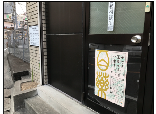
期間限定ポスター

さて、話はがらりと変わりますが、2017年5月30日に、新しい個人情報保護法が施行される予定です。これまでは、取り扱う個人情報が5,000件以下（本当は細かい定義があるのですが、だいたいのイメージで）の事業者は「個人情報取扱事業者」から除外されていたため、厳しいルールは適用されていませんでした。しかし、今回の改正で「5,000人基準」が廃止されましたので、全事業者が規制の対象となってきます。お客様だけでなく、仕入先の担当者や自社の従業員の個人情報なども保護の対象ですので、取り扱いには十分に注意してください。